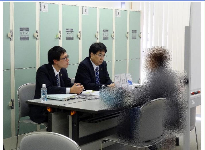
法律に基づいた的確なアドバイスを行います。