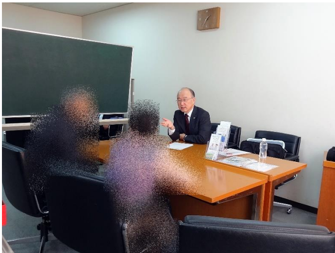
落ち着いた環境で、じっくり相談できます。