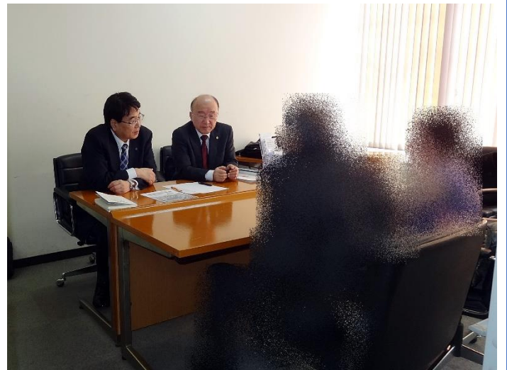
行政書士は、守秘義務がありますので、 安心して相談できます。