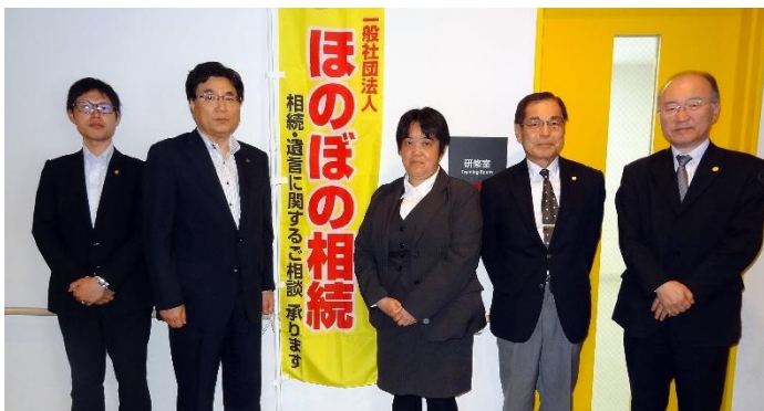
「一般社団法人ほのぼの相続」では、 豊富な人材で皆さまのご相談に応えます。